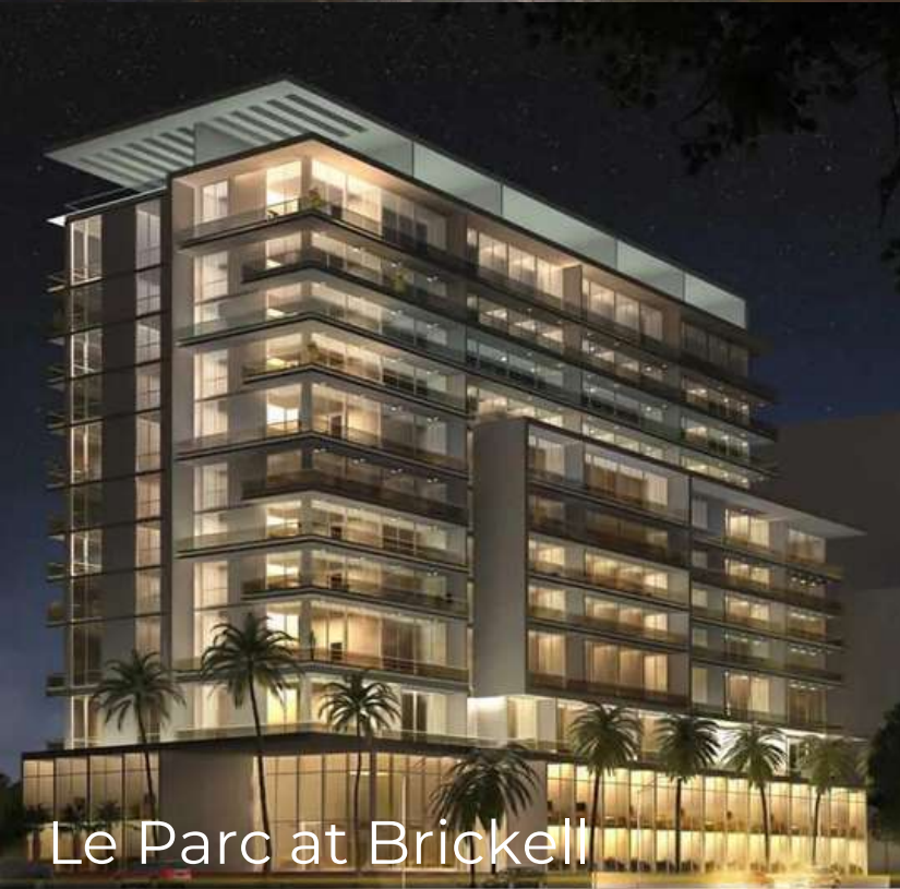
Le Parc at Brickell