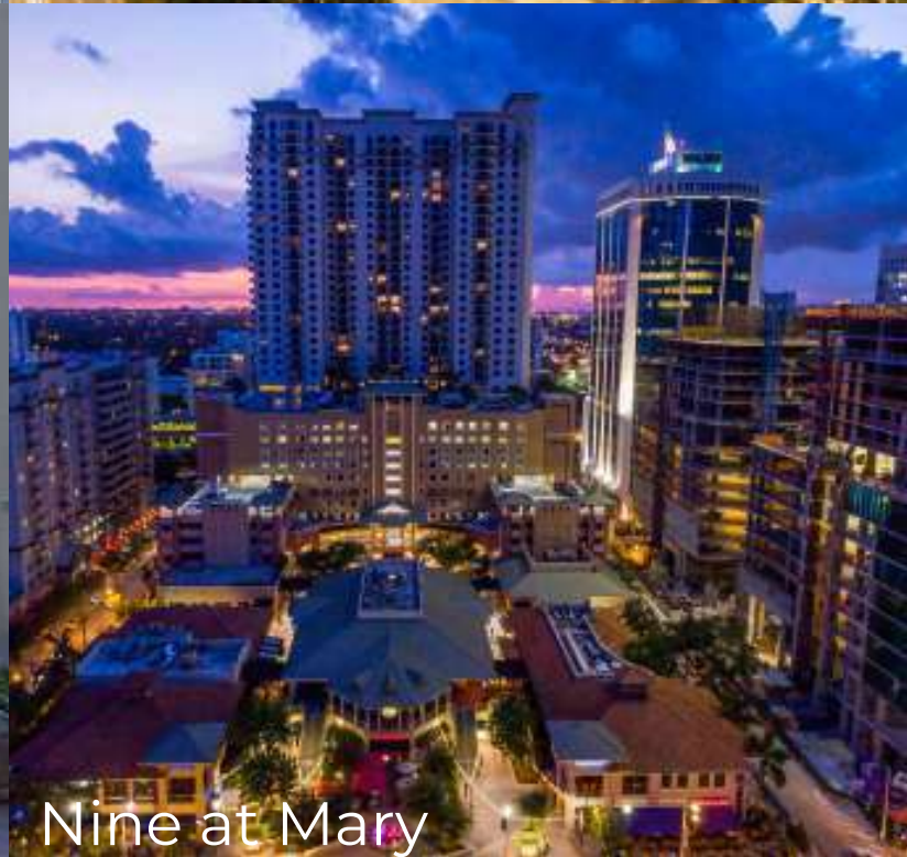
Nine at Mary